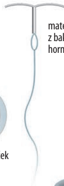
maternični vložki z bakrom ali hormoni